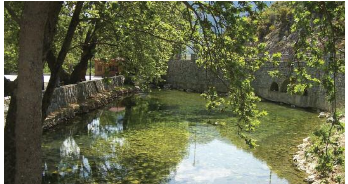
Πηγές Σκορτσινού στην νότια Αρκαδία, το κεφάλι όπου πηγάζει ο κύριος ρους του Ευρώτα.

Με αφετηρία την Σπάρτη υπάρχουν πολλές διαδρομές που στηρίζονται στον άξονα του Ευρώτα και των κύριων παραποτάμων του. Για τους περισσότερους επισκέπτες πρώτιστο μέλημα είναι η επίσκεψη στη Βυζαντινή καστροπολιτεία του Μυστρά - οδικώς είναι μόλις 6 χλμ. από την Σπάρτη. Ο τραγουδισμένος Μυστράς δεν χρειάζεται ιδιαίτερη εισήγηση εδώ όμως γύρω του υπάρχουν δύο εντυπωσιακά και δροσερά φαράγγια. Για να κάνουμε την περιήγηση, ξεκινάμε για Αϊ Γιάννη από την Σπάρτη, και μόλις μετά στο Παρόρι βλέπουμε την πρώτη βαθειά χαράδρα. Για τους περιπατητές προσφέρεται το Φαράγγι της Λαγκαδιώτισσας δίπλα στο Παρόρι, ένα μονοπάτι που επίσης πλησιάζει και τον αρχαιολογικό χώρο της καστροπολιτείας του Μυστρά (βλ. μονοπάτια). Περνάμε το ομώνυμο χωριό και ανεβαίνουμε στα Πικουλιάνικα (με εξαιρετική θέα της κοιλάδας) και στην συνέχεια για Τρύπη, λίγα χιλιόμετρα βόρεια από τον Μυστρά (πάνω στον δρόμο Σπάρτη-Καλαμάτα). Για τους λάτρεις του νερού ιδιαίτερο ενδιαφέρον έχει η ρεματιά και χαράδρα ακριβώς κάτω από την Τρύπη. Εδώ είναι η ευρύτερη περιοχή του αρχαίου Καιάδα, και πολύ κοντά σε αυτό το φοβερό βάραθρο υπάρχει η μεγάλη καρστική πηγή της Τρύπης. Αξίζει επίσκεψη στις πολύ ζεστές μέρες του καλοκαιριού! Παίρνουμε των πιο κατηφορικό τσι-