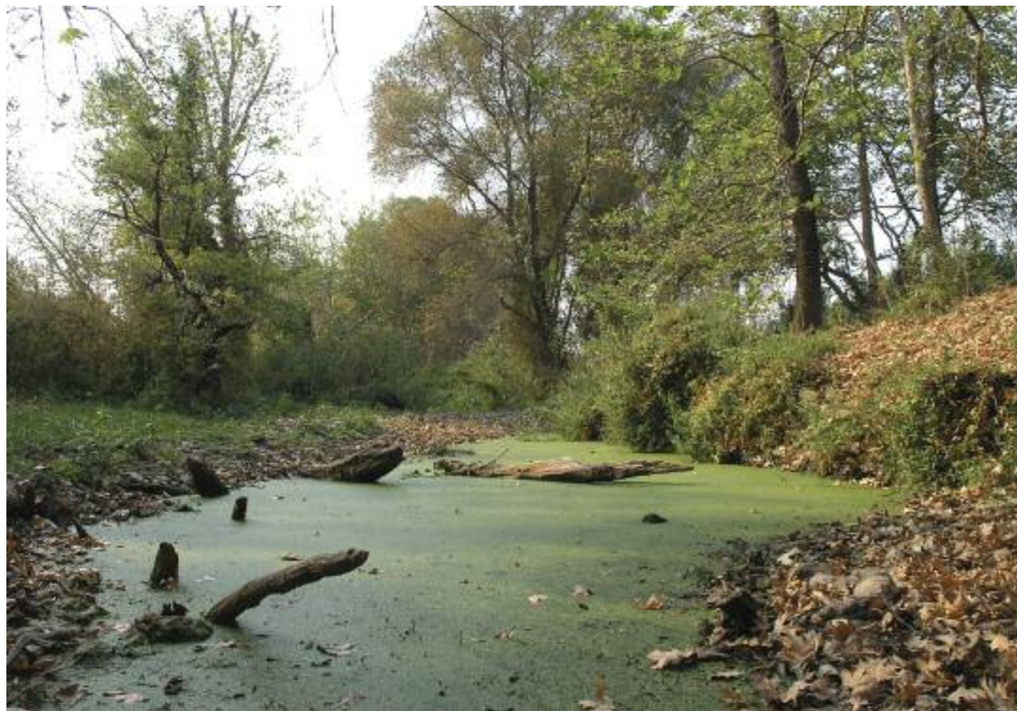
Μικρολίμνες καλυμμένες με το πλευστόφυτο «φακή του νερού» στα Σκούρα.

Λίγα ποτάμια ξεχωρίζουν όπως ο Ευρώτας. Το νοτιότερο μεγάλο ποτάμι της Βαλκανικής ρέει στο άνω άκρο της Πελοποννήσου, μια βιογεωγραφικά πολύ απομονωμένη περιοχή. Η απομόνωση λόγω της ιδιαίτερης γεωλογικής ιστορίας και του έντονα θερμο-μεσογειακού κλίματος δημιουργεί ιδιαίτερα ποτάμια οικοσυστήματα. Εδώ το νερό του ποταμού σχηματίζει οάσεις ζωής, με ενδημικά είδη και σπάνιους φυσικούς σχηματισμούς – η αναζήτηση τους μας ταξιδεύει σε τοπία μοναδικά.