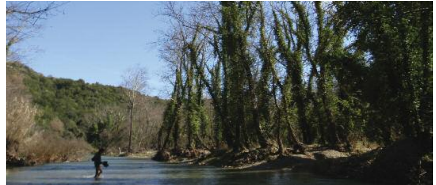
Δροσερά πηγαία νερά στο Βιβαρί, νότια από Πελλάνα.