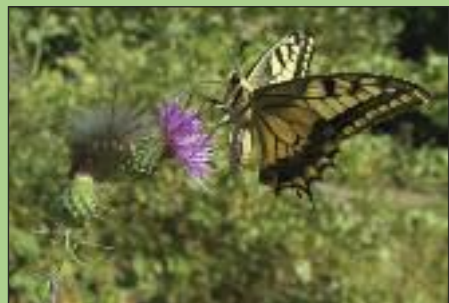
Κοινότατη πεταλούδα στο Καστόρι ( Papilion machaon ).

Η ευρύτερη περιοχή της λεκάνης απορροής του Ευρώτα θεωρείται από τα πιο υδρογραφικά απομονωμένα τμήματα της Ελληνικής Χερσονήσου με αποτέλεσμα να παρουσιάζει ένα μεγάλο αριθμό ενδημικών ειδών κλωρίδας και πανίδας. Η κοιλάδα του Ευρώτα έχει ιδιαίτερη σημασία όχι μόνο για τα μεμονωμένα είδη, αλλά και για διακριτές κοινότητες ειδών (βιοκοινότητες) που δημιουργούν συναθροίσεις που δεν υπάρχουν πουθενά αλλού. Επιπλέον, κάποια από τα φυσικά περιβάλλοντα υδάτινων και παρόχθιων σχηματισμών που απαντούν στον Ευρώτα είναι πράγματι σπάνια στη θερμomesσογειακή βιοκλιματική ζώνη της νότιας Ελλάδας. Αυτά τα σχετικά σπάνια περιβάλλοντα περιλαμβάνουν μεγάλες καρστικές πηγές, παρόχθια δάση, παρόχθια έλη, μεγάλα πηγαία τμήματα ποταμών διαρκούς ροής, δυσπρόσιτα φαράγγια και χαράδρες, δελταϊκά έλη και γλυκόβαλτους καθώς και εκβολικά στόμια ποταμών. Αυτό το «δίκτυο» φυσικών βιοτόπων υπάρχει σε όλο του ρου της κοιλάδας δημιουργώντας ένα σύμπλεγμα πολύτιμων βιοτόπων που πράγματι στηρίζουν την ξεχωριστή