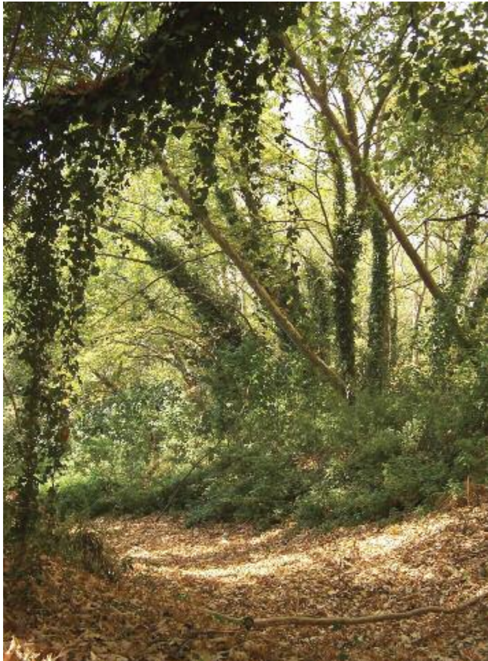
Τμήμα του Ευρώτα που έχει μόλις στεγνώσει μετά από καύσωνα τον Αύγουστο (περιοχή Μολαΐτη).