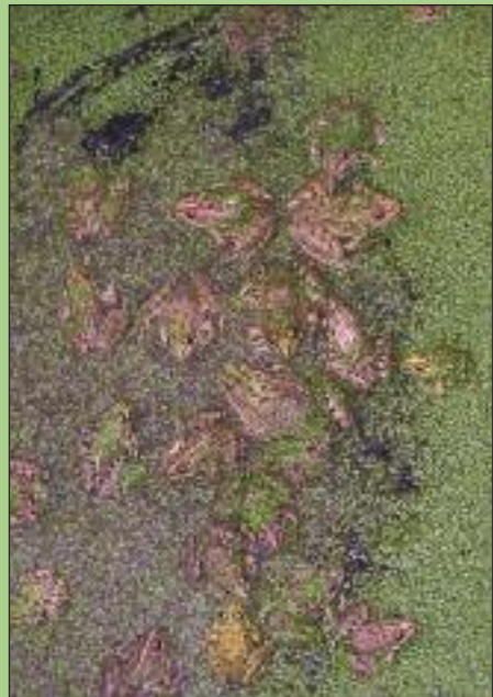
Καλοκαιρινή συγκέντρωση λιμοβατράχων ( Rana balcanica ).