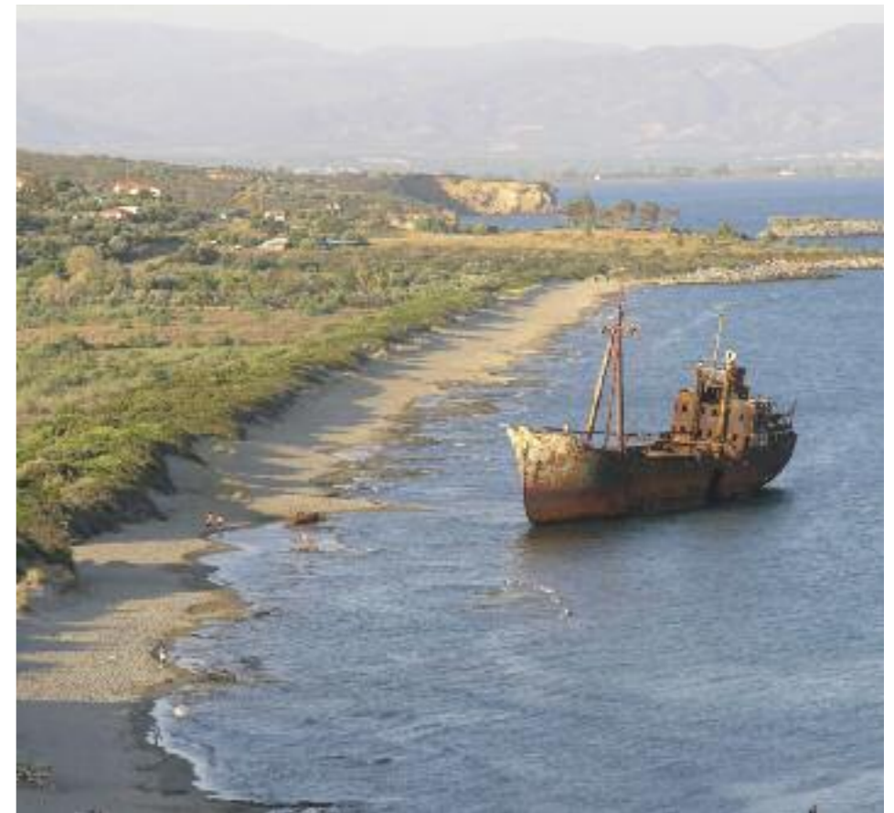
Το ναυάγιο στην παραλία Βαλτάκι. Πίσω από τις θίνες υπάρχει ένας αξιόλογος μικρός υγρότοπος.

διαφέρον όλη η περιοχή- ιδίως την άνοιξη όταν πλημμυρίζουν μεγάλες εκτάσεις υγρών λιβαδιών και λιμνοθαλάσσιων αλίπεδων μόλις ανατολικά της εκβολής (περιοχή Βιβάρι κοντά στο Έλος). Στην περιοχή τότε μπορείτε να δεις πολλά πολύ σπάνια είδη μεταναστευτικών πουλιών όπως βαλτόπαπες, χαλκόκοτες και σμήνη μεταναστευτικών ερωδιών. Συνολικά 244 είδη πουλιών έχουν καταγραφεί. Προφανώς η περιοχή έχει περισσότερη ζωντάνια τον χειμώνα και την άνοιξη όταν έχει νερό! Νωρίς το καλοκαίρι στην παραλία φωλιάζουν και θαλάσσιες χελώνες. Αυτό που μένει έντονα στην μνήμη βέβαια με μια καλοκαιρινή επίσκεψη στο Δέλτα είναι η σοβαρή αποτυχία της προστασίας των υγροτόπων της Ελλάδας- ιδιαίτερα των μικρών και όχι τόσο διάσημων. As ενώσουμε τις δυνάμεις μας με τους ντόπιους περιβαλλοντιστές, τους ορνιθολόγους και χελωνάδες που προσπαθούν να σώσουν ότι έχει απομείνει.