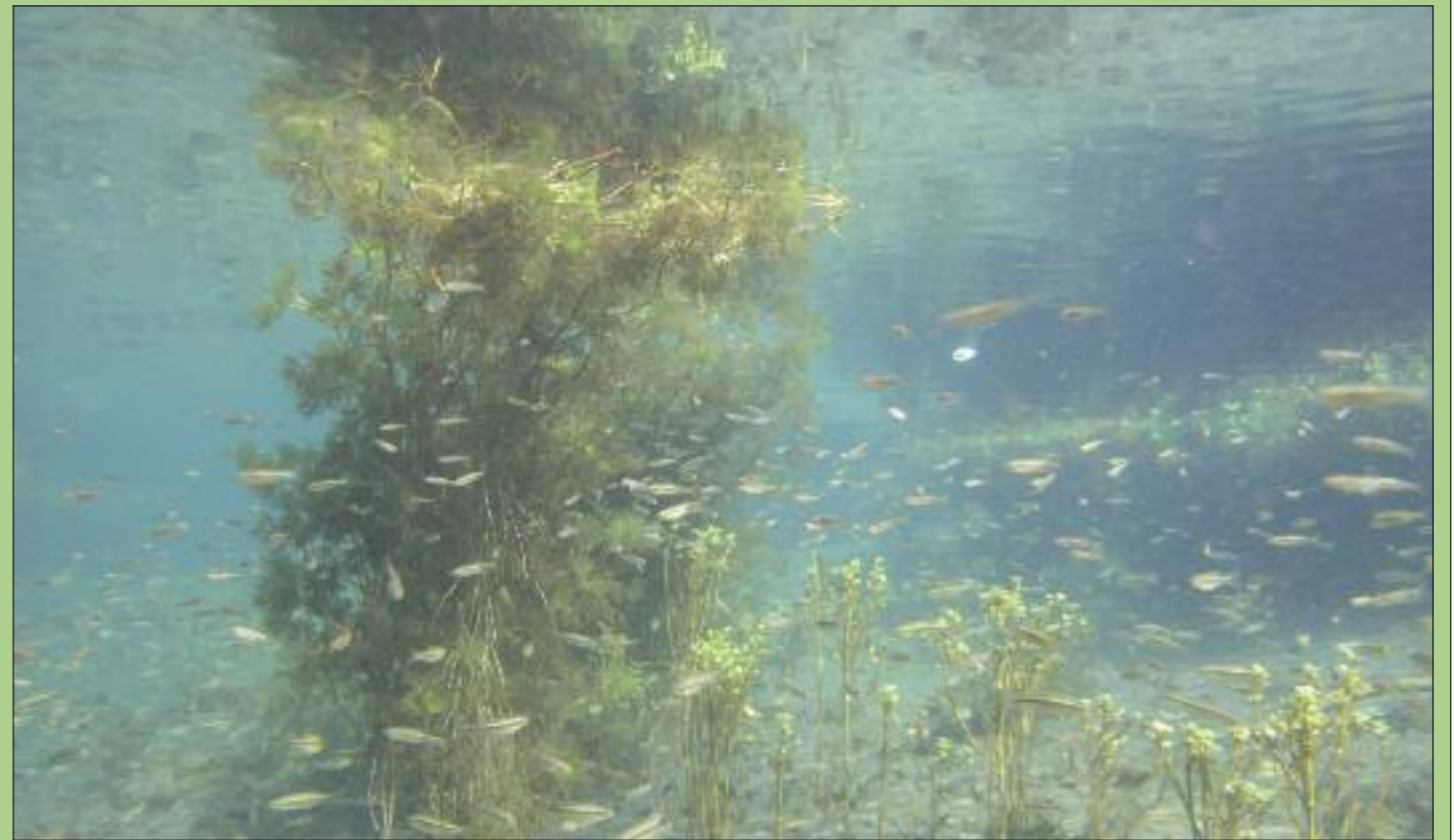
Υποβρύχιοι «κρεμαστοί κήποι» στο μεγάλο κεφαλάρι μέσα στον ποταμό Ευρώτα, μόλις πάνω από την Γέφυρα Σπάρτης.

του Αλφειού. Το τρίτο από τα σπάνια και προστατευόμενα ψάρια είναι ενδημικό της Ν. Πελοποννήσου, η χρυσή μενίδα Tropidophoxinellus spartiaticus . Τα τρία ενδημικά είδη είναι πράγματι απειλούμενα και αυστηρώς προστατευόμενα. Αυτά τα σπάνια είδη συμπληρώνονται από ένα κοσμοπολίτικο είδος, το χέλι Anguilla anguilla , και ένα περιμεσογειακό, την ποταμοσαλιέρα Salaria fluviatilis . Τέλος, δύο είναι ψάρια (αμερικανικής προέλευσης) έχουν εισαχθεί από το άνθρωπο στην περιοχή: το κουνουπόψαρο Gambusia holbrooki και η ιριδίζουσα πέστροφα Oncorhynchus mykiss .