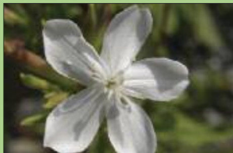
Σε δροσερά σημεία τα φυτά ανθίζουν και το καλοκαίρι.

βιοποικιλότητα της περιοχής. Συχνά ακούμε για τα πουλιά και τις θαλάσσιες κελώνες του Λακωνικού, όμως ο Ευρώτας έχει πολλά περισσότερα αξιοθαύμαστα. Δύο από τα ιδιαίτερα χαρακτηριστικά του ποταμού - που λαμβάνουν μάλλον λιγότερη διαφήμιση - είναι τα ψάρια και τα παρόχθια δάση του.