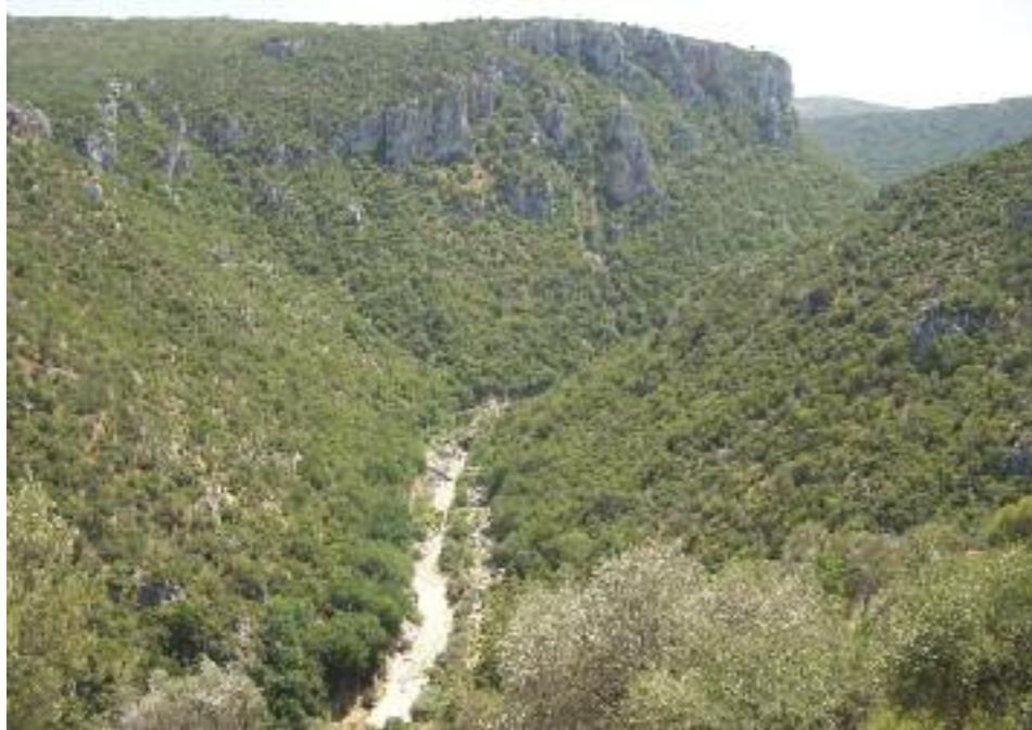
Θέα του πάνω τμήματος της Χαράδρας Βρονταμά από το Παλιομονάστηρο.