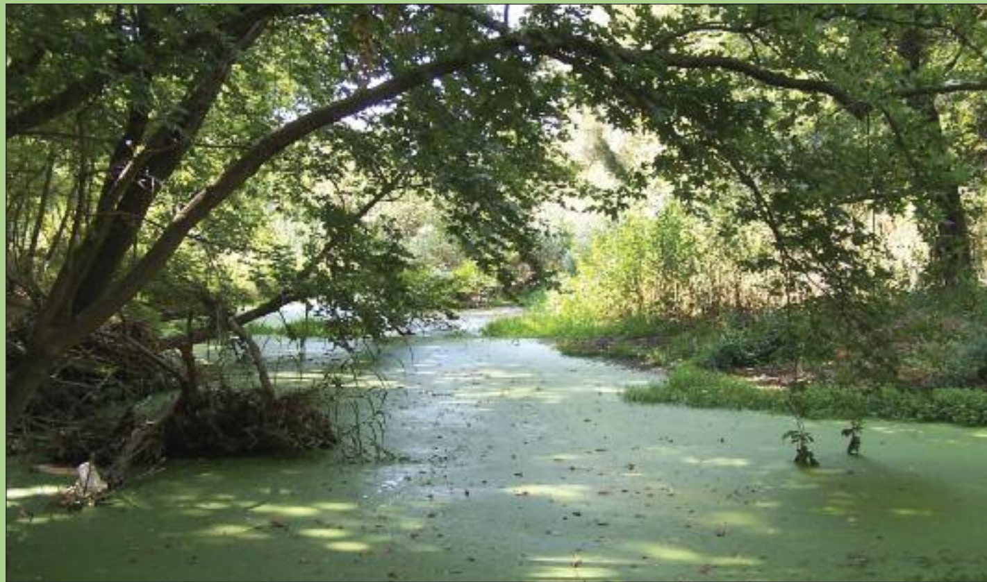
Δροσερή όαση ζωής στο μεγάλο παρόχθιο δάσος Σκούρα - Λευκόκωμα.