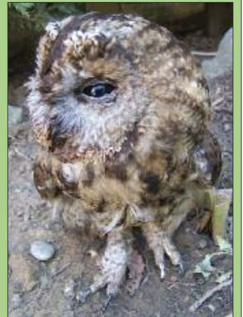
Ο Χουκουριστής ( Strix aluco ) είναι κοινό νυκτόβιο αρπακτικό στα παρόχθια δάση του Ευρώτα.