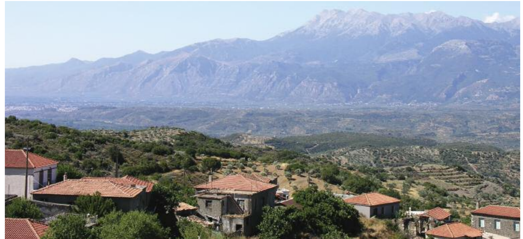
Θέα της κοιλάδας του Ευρώτα και του Ταΰγету από την περιοχή Σελασία - Κονιδίτσα.

και το καλοκαίρι. Μια εύκολη περιήγηση από την Σπάρτη ακολουθεί το δυτικό τμήμα της στενής κοιλάδας πάνω στους πρόποδες του δασωμένου βόρειου Ταΰγету (προς το Καστόρι). Κατευθυνόμαστε βόρεια προς Καραβά και Βορδόνια, προς το όμορφο ημι-ορεινό χωριό Καστόρι (480 μέτρων υψόμετρο), όπου συναντάμε κύριο παραπόταμο του Ευρώτα, το ρέμα Καστο-