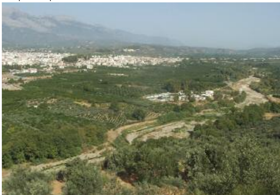
Θέα προς την Σπάρτη από το Μεναλάιον.

Υπάρχουν δύο σημεία που λειτουργούν ως καλές βάσεις εξορμήσεων, πρωταρχικώς η Σπάρτη και δευτερευόντως το Γύθειο. Πραγματικά κεντρική θέση στην κοιλάδα έχει η Σπάρτη από όπου μπορούμε να εξερευνησουμε διάφορα τμήματα όλου του ποταμού. Το Γύθειο βολεύει τους καλοκαιρινούς μήνες επειδή είναι πάνω στην θάλασσα και βέβαια ενδείκνυται περισσότερο για νότια τμήματα της κοιλάδας και