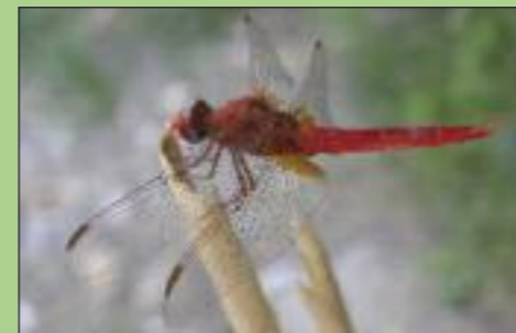
Κόκκινη λιβελούλα του βάλτου.

Ίσως από τα σημαντικότερα στοιχεία του ποταμού είναι τα ψάρια του - οι ντόπιοι τα εκτιμούν διότι παλιά το ποτάμι έτρεφε το λαό! Συνολικά, η ιχθυοπανίδα των γλυκών νερών του ποταμού Ευρώτα αποτελείται από 5 αυτόχθονα είδη και δύο εισαχθέντα. Σε αυτά προστίθενται και τουλάχιστον άλλα 5 τυπικά εκβολικά είδη θαλασσινής προέλευσης που κινούνται κυρίως στις εκβολές και στον κάτω ρου του ποταμού (κεφαλόπουλα, λαβράκια, αθερίνα, γοβισί κ.α.). Από τα είδη που διαβιούν στα γλυκά νερά του Ευρώτα, δυο είναι τοπικά ενδημικά, η Καιαδική κενίδα Squalius keadicus υπάρχει μόνο εδώ και ο Λακωνικός πελασγός Pelagus lasocticus απαντά μόνο εδώ και στον άνω ρου