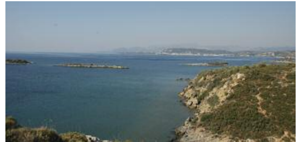
Οδεύοντας προς το Δέλτα το τοπίο ακολουθεί όμορφη φυσική ακτή. Θέα προς το Γύθειο από τα Τρίνισα.

λαβράκια, βατράχια, νερόφιδα – όλο ζωή το νερό! Αν έχετε λίγο χρόνο φθάνετε πολύ εύκολα (περίπου 5 κλμ.) στην παραλία και εκβολή του καναλιού, στην καρδιά του Δέλτα. Από εδώ περπατήστε ανατολικά προς την εκβολή (200 μ.). Εδώ η παραλία φαντάζει απέραντη αλλά στην ουσία βρισκόμαστε μόλις 1.7 κλμ από την εκβολή του Ευρώτα. Για να φθάσουμε στην εκβολή του Ευρώτα οδικώς, γυρνάμε πίσω στον επαρχιακό δρόμο, διασχίζουμε την Σκάλα (αγροτικός οικισμός χωρίς τουριστικό ενδιαφέρον) και μετά τα τελευταία σπίτια του οικισμού στρίβουμε δεξιά σε χωματόδρομο πριν την γέφυρα. Ευθεία πάνω στο ανάχωμα του ευθυγραμμισμένου ποταμού φθάνουμε στην εκβολή (6 κλμ. χωματόδρομο από την γέφυρα της Σκάλας). Μην περιμένετε έναν θαματικό υγροτοπικό παράδεισο...είναι περισσότερο κάμπος με πορτοκαλεώνες, αποξηραμένες λιμνοθάλασσες, και καταπατημένες αμμοθίνες...Έχει όμως τεράστιο οικολογικό εν-