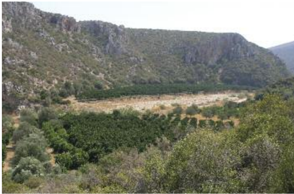
Μικροί πορτοκαλέωνες στο κέντρο της Χαράδρας του Βρονταμά.

ρίου. Το χωριό είναι όμορφο κεφαλοχώρι με δύο κατάφυτες ρεματιές. Παρότι παλιό, ιστορικό χωριό, το όνομα του το πήρε σχετικά πρόσφατα από το μυθολογικό ήρωα Κάστορα (μετονομάστηκε το 1921, ενώ πριν ήταν γνωστό ως Καστανιά). Το χωριό, όπως και πολλά άλλα μικρά χωριά κοντά σε πηγές στις πρόποδες του Βόρειου Ταυγέτου έχει πολλά κτήρια φτιαγμένα από λαγκαδιανούς μαστόρους, όπου κυριαρχεί το λιθόκτιστο διώροφο και σχεδόν όλα τα σπίτια έχουν κεραμίδια. Η κύρια ρεματιά του χωριού (στην βόρεια απόληξη του οικισμού) σχηματίζει μαγευτική δασωμένη χαράδρα – τόπος που είναι εξαιρετικά δροσερός, και ταιριάζει για περίπατο μιας ώρας – ακόμη και με καύσωνα μεσοκαλοκαιρα (βλ. μονοπάτια). Υπάρχει ένα απλό παραποτάμιο μονοπάτι που σε ταξιδεύει σε σπάνιες δασοσυστάδες με σκλήθρα ( Alnus glutinosa ) και καταλήγει σε ένα απίθανο φαράγγι...υγρό καταφύγιο για πεταλούδες της Ρόδου!