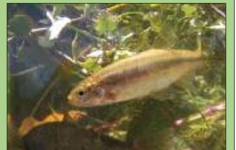
Χρυσή μενίδα - Υπάρχει μόνο στην Νότια Πελοπόννησο.