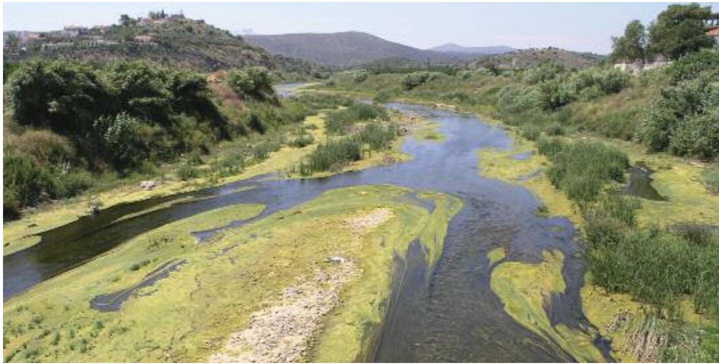
Ο Ευρώτας μόλις πριν το Δέλτα του, στην γέφυρα της Σκάλας.