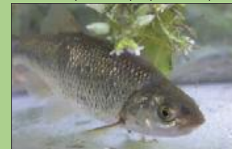
Καιαδική μενίδα - Υπάρχει μόνο στον Ευρώτα!

Στο εκβολικό σύστημα υπάρχουν εκτεταμένοι χαμηλοί θαμνώνες με αλμυρίκια ( Tamarix spp. ) καθώς και σε πολλούς παραποτάμους περιοδικής ροής κυριαρχούν συστάδες μικροδάφνης ( Nerium oleander ) και λυγαριάς ( Vitex agnus-castus ). Ο Ευρώτας έχει τα πιο εκτεταμένα και καλύτερα διατηρημένα πεδινά παρόχθια δάση από κάθε άλλο ποταμό στην Πελοπόννησο. Ιδιαίτερα σημαντικά είναι κάποιες δασικές διαπλάσεις με σκλήθρο ( Alnus glutinosa ) που αποτελούν οικότοπο προτεραιότητας βάσεις της Οδηγίας 92/43/ΕΟΚ. Σε πέντε σημεία στον Ευρώτα προσδιορίστηκαν εξαιρετικά δείγματα παρόχθιων δασών που κρίνονται ιδιαίτερα σημαντικά για την διατήρηση της βιοποικιλότητας (Πανεπιστήμιο Ιωαννίνων/ ΕΛΚΕΘΕ 2007). Τα σημεία αυτά περιλαμβάνουν το Καστόρι, το Βιβάρι, το Δάσος Σκούρας-Λευκόκωμα και την Χαράδρα του Βρονταμά. Δυστυχώς, τα τοπία αυτά δεν υπάγονται σε καμία ζώνη ειδικής προστασίας και είναι εξαιρετικά απειλούμενα και ευάλωτα σε ανθρωπογενείς πιέσεις.