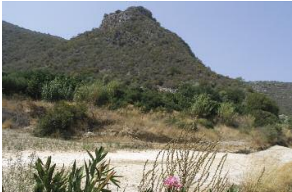
Το πάνω τμήμα της Χαράδρας Βρονταμά.