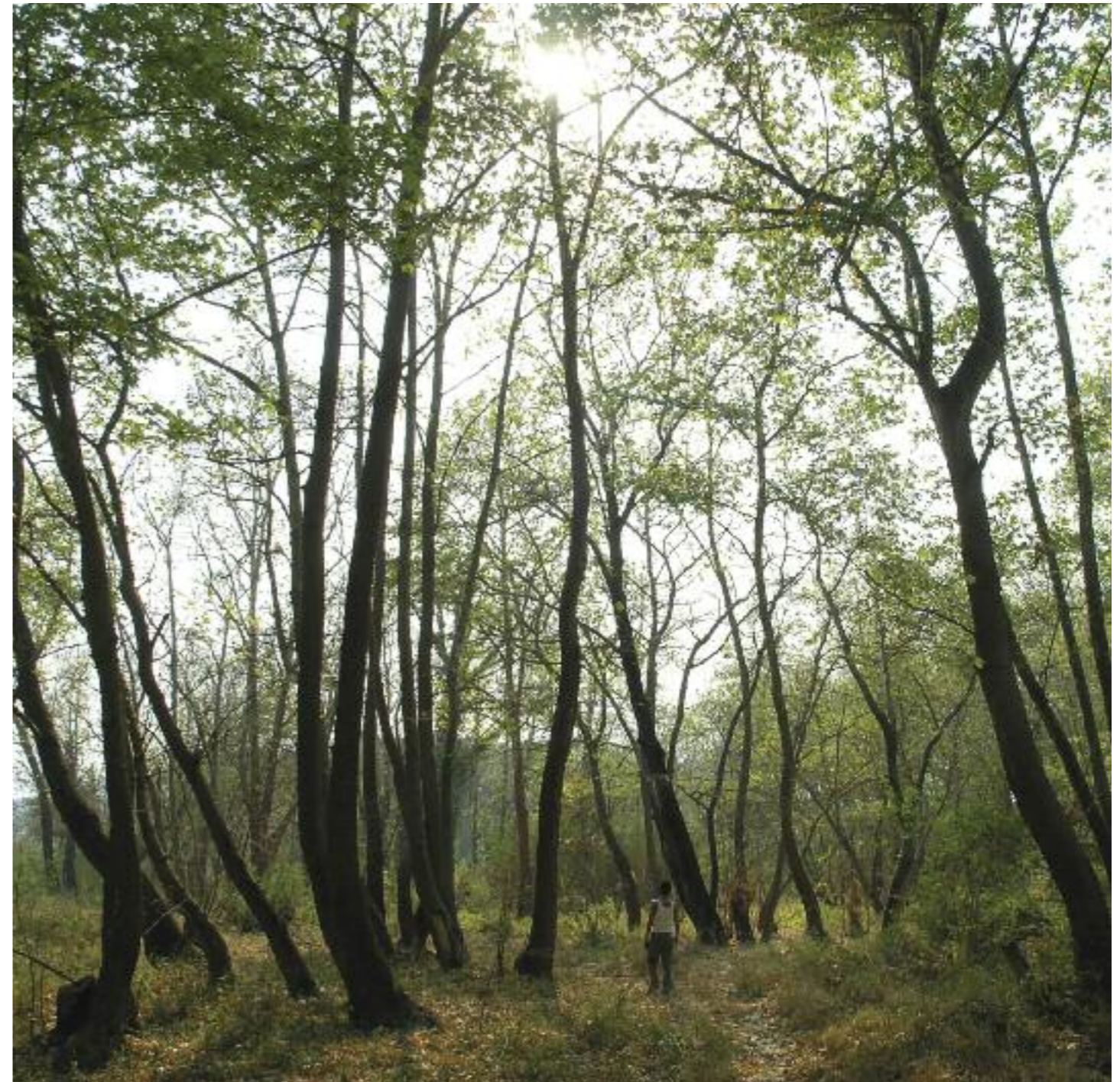
Πλατανοδάσος κοντά στο Λευκόκωμα- σε αυτό το σημείο το δάσος έχει 300 μέτρα πλάτος –σπάνιο σχηματισμός σε πεδινό ποτάμι στην νότια Ελλάδα.

Στο σημείο που βλέπουμε τον πρώτο χωματόδρομο, βλέπουμε ότι συμβάλει και ένα άλλο ξερόρεμα από τις Κροκέες και εδώ καλλιεργούνται και πορτοκάλια δίπλα στο ποτάμι. Από εδώ έχουμε άλλα 6 χλμ. ως το τέλος του φαράγγιού. Παρότι υπάρχει χωματόδρομος δίπλα στην κοίτη πολύ σπάνια βλέπεις αυτοκίνητο και στο νότιο τμήμα υπάρχουν μεγάλα βράχια όπου φωλιάζουν αρπακτικά πουλιά. Όταν φθάσουμε στο τέλος και αισθανόμαστε τον δελταϊκό κάμπο βρισκόμαστε μόλις 1.5 χλμ από τον πλησιέστερο συνοικισμό (το Φιλήση δίπλα στο Περιστέρη στην Ανατολική όχθη του ποταμού). Αλλιώς συνεχίζουμε για τρία χιλιόμετρα ακόμη ως την Γέφυρα δίπλα στον οικισμό της Σκάλας. Τονίζουμε ότι αυτή η διαδρομή δεν είναι γνωστή σε περιπατητές με εξαίρεση κάποιους μανιακούς στην Σκάλα και τους λίγους ειδικούς που ασχολούνται με την μελέτη Τσακαλιών (!). Γενικά η περιοχή παραμένει ανεξερεύνητη.