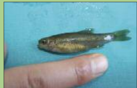
Λακωνικός πελασγός - Υπάρχει μόνο στην Λακωνία και νότια Αρκαδία.

Στο εκβολικό σύστημα υπάρχουν εκτεταμένοι χαμηλοί θαμνώνες με αλμυρίκια ( Tamarix spp. ) καθώς και σε πολλούς παραποτάμους περιοδικής ροής κυριαρχούν συστάδες μικροδάφνης ( Nerium oleander ) και λυγαριάς ( Vitex agnus-castus ). Ο Ευρώτας έχει τα πιο εκτεταμένα και καλύτερα διατηρημένα πεδινά παρόχθια δάση από κάθε άλλο ποταμό στην Πελοπόννησο. Ιδιαίτερα σημαντικά είναι κάποιες δασικές διαπλάσεις με σκλήθρο ( Alnus glutinosa ) που αποτελούν οικότοπο προτεραιότητας βάσεις της Οδηγίας 92/43/ΕΟΚ. Σε πέντε σημεία στον Ευρώτα προσδιορίστηκαν εξαιρετικά δείγματα παρόχθιων δασών που κρίνονται ιδιαίτερα σημαντικά για την διατήρηση της βιοποικιλότητας (Πανεπιστήμιο Ιωαννίνων/ ΕΛΚΕΘΕ 2007). Τα σημεία αυτά περιλαμβάνουν το Καστόρι, το Βιβάρι, το Δάσος Σκούρας-Λευκόκωμα και την Χαράδρα του Βρονταμά. Δυστυχώς, τα τοπία αυτά δεν υπάγονται σε καμία ζώνη ειδικής προστασίας και είναι εξαιρετικά απειλούμενα και ευάλωτα σε ανθρωπογενείς πιέσεις.