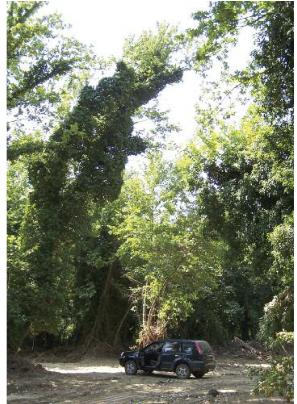
Εξερευνώντας παραποτάμιες ζούγκλες νότια από το Βιβαρί.

Από εδώ βγαίνουμε στον κεντρικό δρόμο Σπάρτης-Γυθείου και πορευόμαστε νότια προς Λευκόχωμα, μικρό άσπημο χωριό πάνω σε δρόμο που οδεύει κοντά στο ποτάμι. Μέσα σε αυτό το χωριό παίρνουμε το χωματόδρομο με κατεύθυνση προς Βρονταμά (ακολουθούμε πινακίδες). Σε κάποιο σημείο υπάρχει ένας μικρός συνοικι-