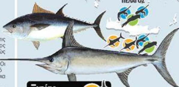
Ξιφίας και τόνος