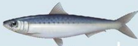
Γαύρος και σαρδέλα

Τις περιοχές των ελληνικών θαλασσών που προτιμούν συγκεκριμένα είδη ψαριών για να τραφούν και να αναπαραχθούν κατέγραψαν επιστήμονες. Με τη βοήθεια πληροφοριών από περιβαλλοντικούς δορυφόρους, μελέτησαν τα ιδιαίτερα χαρακτηριστικά των ενδιαιτημάτων τους